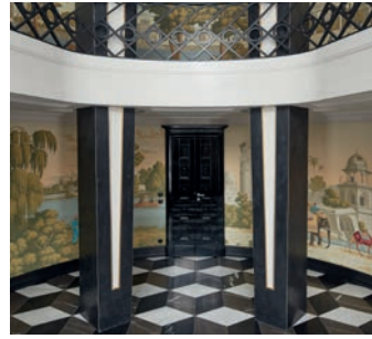
Wohnung in Mitte zeigt eine Eleganz, wie man sie von Stadthäusern in Paris oder London kennt – Seite 38.