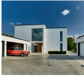
Architektenvilla in Brandenburg reagiert ungewöhnlich vielschichtig auf eine Wasserlage – Seite 10.